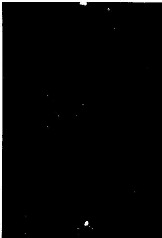
Fig. 2. IBR fluorescent viral antigen in HeLa cell culture, 36 hrs. after inoculation with tonsil emulsion. x200.

考慮將免疫用抗原以超高速遠心分離器等予以精製或使用牛隻製作高度免疫血清，以避免非特异性螢光之產生。